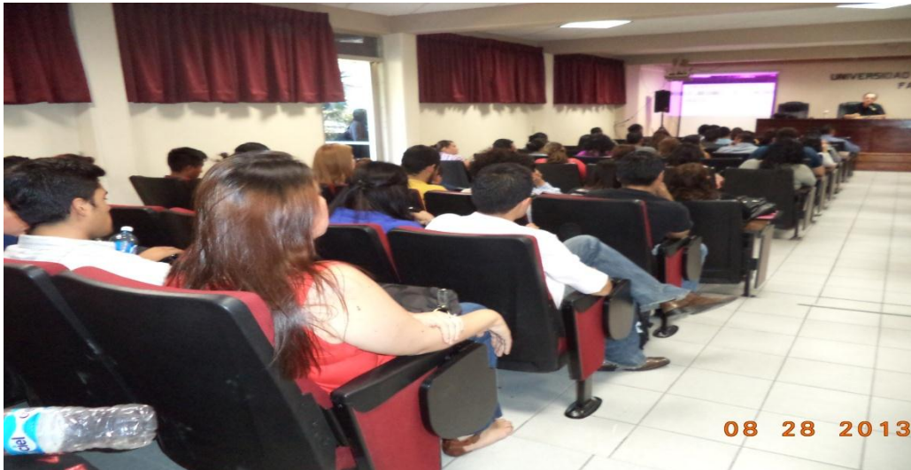
Figura 3. Fotografía de un taller de información de prácticas profesionales, informe rendido por el Coordinador de Prácticas Profesionales el 23 de septiembre de 2013.